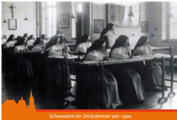
Schwestern im Stickzimmer um 1900