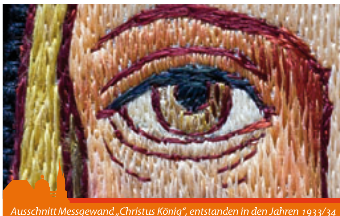
Ausschnitt Messgewand „Christus König“, entstanden in den Jahren 1933/34

Hätten nicht einige Schwestern einen Job annehmen können, um Geld zu verdienen? Nein, denn welchen Beruf sie auch immer angenommen hätten, er war nicht vereinbar mit der bedingungslosen Sorge für die Kinder. Ebenso war ein Beruf nicht kompatibel mit dem klösterlichen Leben bzw. den regelmäßigen Gebetszeiten, die wesentlich zum Gelingen klösterlicher Gemeinschaft dazu gehören. Aber schon in den Jahren der Gründung bahnte sich ein später recht lukrativer Wirtschaftsfaktor an, und der hatte etwas mit dem Gottesdienst zu tun. Aber langsam! Nicht nur zu einem „normalen“ christlichen Leben gehört die Feier von Gottesdiensten zum Alltag, also die Feier der Kommunikation mit Gott. Besonders für die Lebendigkeit einer Ordensgemeinschaft ist Gebet und Gottesdienst konstitutiv! Ohne Kommunikation mit Gott geht letztendlich gar nichts. Schöpfen doch die Schwestern aus ihr -damals wie heute- die Kraft für ihr „weltliches“ Engagement.