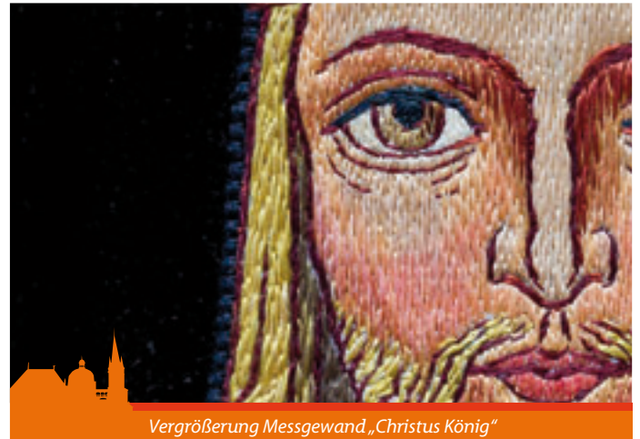
Vergrößerung Messgewand „Christus König“

Für die Eucharistiefeier, für jede Form des Gottesdienstes bedarf es liturgischer Gewänder und Geräte, sogenannter „Paramente“ und „Kultgeräten“. Anfänglich liehen sich die Schwestern diese Dinge in Aachener Gemeinden aus. Allerdings wuchs das Bestreben, auch aus ästhetischen Gründen, die Gewänder und andere Stoffe für die Liturgie selbst herzustellen. Im Oktober 1848 fertigten die Schwestern hier in Aachen ihr erstes Messgewand. Das hatte Folgen! 1855 entstand die erste Werkstadtniederlassung über Aachen hinaus in Köln und weiter ging es dann u. a. auch in Luxemburg und Österreich.