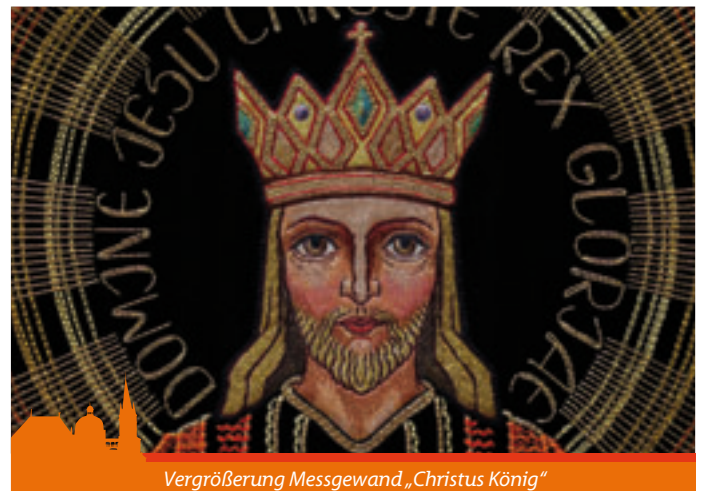
Vergrößerung Messgewand „Christus König“