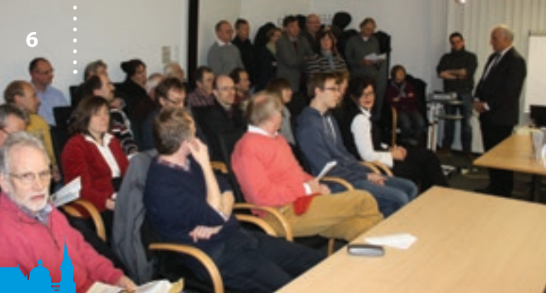
Hohes Interesse bei den Laurensberger Bürgern.