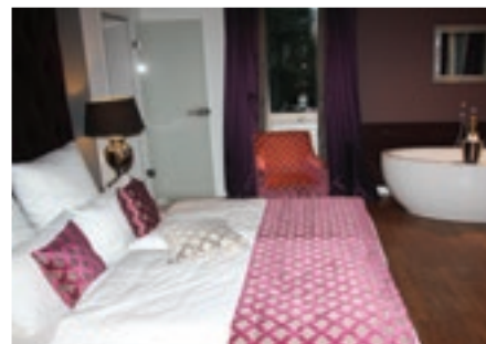
Wunderschöne Apartments erwarten die Gäste im Boarding House